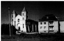
Nowy kościół katolicki i plebania w Berezie