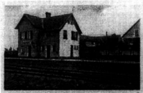
Stacja kolejowa w Ochli gdzie przybył pierwszy transport z Berezy, dziś budynek mieszkalny przy ul. Kozuchowskiej 35